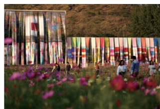
Photo : Jim Thompson Foundation Courtesy of the artist and Jim Thompson Foundation