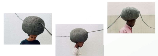
〈Un negro es un negro〉「Porters Wigs」シリーズ、1997-2001

彼女は、表象やアイデンティティにまつわる問いや、人種や脱開発論についての議論に関する問いから、記憶や権力のあり様を考察する。それらの課題と向き合うため、プロジェクトに参加する人々の身体や、イメージ、経験を通して、ジェンダー、民族性、言語、歴史、政治について考えていく。彼女の芸術実践は、複数のメディア、パフォーマンス型な活動、文化的慣習、歴史的賠償、また社会組織との共同制作などの要素を包含する。これまでコロンビア国内外で個展やグループ展に参加。芸術活動は必要不可欠であるという理解のもと、芸術分野のあらゆる側面で活躍する。ボゴダ市の文化部門とも協働したことがある。