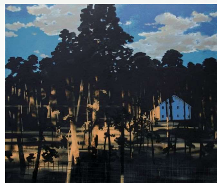
《難民キャンプ》2020

モハンマド・サーミは、紛争や暴力の持つ過激なイメージに対抗する寓意的な表現としての絵画に取り組む。彼の絵画は、日常のものやありふれたものから想起される在りし日の記憶、つまり故郷のイラクから難民としてスウェーデンに移住してきたときの記憶を辿ろうとするものである。