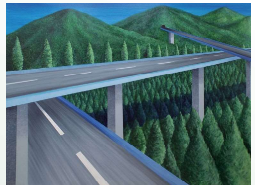
《高速道路のある風景》2019

近年の主な展示に、「あざみ野コンテンポラリーvol.10 しかくのなかのリアリティ」横浜市民ギャラリーあざみ野(2019年、神奈川)、「瀬戸現代美術展」瀬戸サイト(2019年、愛知)、「組み合わせ」See Saw gallery + hibit(2018年、愛知)、「不自由なしかく」GALLERY ZERO(2018年、大阪)など。