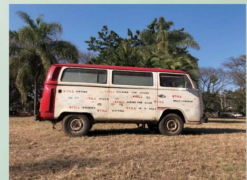
《Still Still》2012-現在

近年は、展覧「Talk to me while I'm eating」グッドマン・ギャラリー・ロンドン(2021年、英国)、「Allied with Power」パレス・アート・ミュージアム・マイアミ(2020年、米国)、第22回シドニー・ビエンナーレ(2020年、オーストラリア)に参加。その他、第54回ヴェネチア・ビエンナーレ(ジンバブエ代表、2011年、イタリア)など。