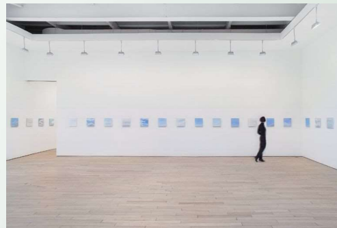
「サンデー・ペインティング、2001年1月7日～2018年2月11日」の展示風景 2018年1月5日～2月17日

キムの作品で最も知られているのは、1993年のホイットニー・ビエンナーレに出品され、現在も制作継続中の絵画《提喻(Synecdoche)》(ワシントン・ナショナル・ギャラリー、米国に収蔵)だろう。人間の肌の色を表した何百ものパネルがグリッド上に構成され、単色の抽象画であり、集団の肖像画とも言える作品だ。