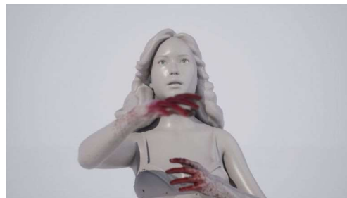
《Jokanaan》2019年 愛知県美術館蔵

主な個展に「I.C.A.N.S.E.E.Y.O.U」EFAG East Factory Art Gallery(2020年、東京)、「サンプルボイス」横浜美術館アートギャラリー1(2014年、神奈川)、グループ展に「彼女たちは歌う」東京藝術大学大学美術館陳列館(2020年)、「六本木クロッシング2016展」森美術館(東京)、「アーティスト・ファイル2015 隣の部屋——日本と韓国の作家たち」(2015年、国立新美術館、東京/2016年、韓国国立現代美術館、果川)など。2016年度アジア・カルチュラル・カウンシルの助成を受けニューヨークに滞在。