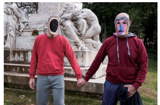
《時代の精神 -L'esprit de notre temps- (サンパオロ・デル・ブラジレ通り、ローマ)》2021 © Prinz Gholam

ヴォルフガング・プリンツ 1969年ロイトキルヒ(ドイツ)生まれ。 ミシェル・ゴラーム 1963年バイルート(レバノン)生まれ。