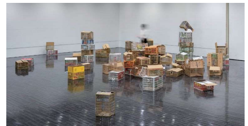
〈はうれん草たちが口本語で夢を見た日〉2020、神戸アートビレッジセンター

これまでに、水戸芸術館、弘前れんが倉庫美術館、東京都現代美術館など国内各地の他に、ボストン美術館(米国)、ユダヤ博物館(ニューヨーク、米国)、上海当代美術館(中国)などで展示し、オーストラリアと米国でアーティスト・イン・レジデンスに参加。また、日産アートアワード2020にてグランプリ受賞。