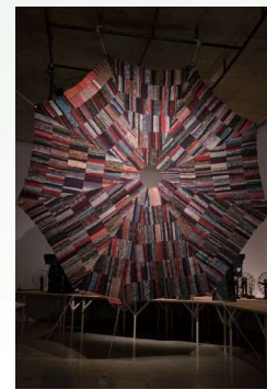
〈閃光と落下傘〉2020、国際芸術センター青森

2013年沖縄県立芸術大学工芸専攻染織科卒業。2016年志村ふくみ(紬織、重要無形文化財保持者)主宰、アルスシムラ卒業。ベトナムと沖縄、東京と各地方を拠点に、その地に根ざした工芸と歴史、生活と密接な関係にある政治の係性を紐解き、主に染織技法を用いて、制作発表を続けている。主に雑巾や落下傘、船の帆を制作し「使う」ことで布の生と人々の生を自身の身体を用いてパフォーマンスにトレースし、工芸の本質を拡張することを制作の核とする。最近の主な展示に「第13回 shiseido art egg」資生堂ギャラリー(2019年、東京)、「Welcome, Stranger, to this Place」東京藝術大学大学美術館(2021年)など。「第13回 shiseido art egg」ではart egg大賞を受賞した。