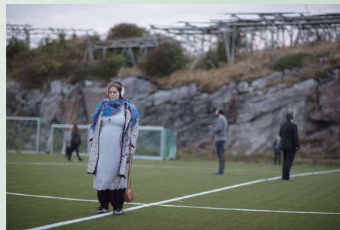
《グッドネーム(バッドフリース)》2017

近年の主な展覧にジユド・ボーム国立美術館(2019年、パリ、フランス)、国際展には光州ビエンナーレ(2016年、韓国)など。国内では2021年に東京都現代美術館の「MOTアニュアル2021 海、リビングルーム、頭蓋骨」にて紹介される。