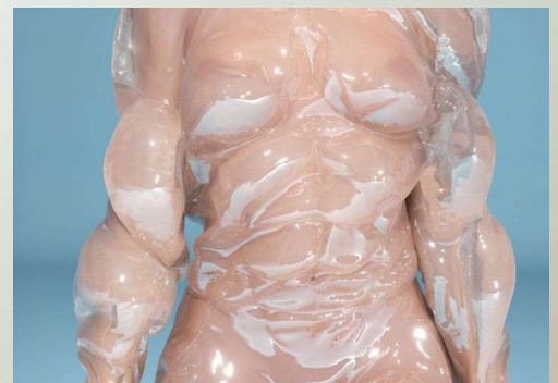
〈インフェクション・ドライブス〉2018

台北市立美術館(台湾)と2021ニュー・ミュージアム・オブ・コンテンポラリー・アート・トリエンナーレ(ニューヨーク、米国)での展覧会が予定されている。近年開催した個展は「Symptom Machine」SCAD美術館(2021年、ジョージア、米国)、「Screens Series: Kate Cooper」ニュー・ミュージアム・オブ・コンテンポラリー・アート(2020年、ニューヨーク、米国)、「Symptom Machine」ヘイワード・ギャラリー(2019年、ロンドン、英国)、「Sensory Primer」ア・テイル・オブ・ア・タブ(2019年、ロッテルダム、オランダ)など。また、グループ展ではデュッセルドルフ美術館(2021年、ドイツ)、パレ・ド・トーキョー(2020年、パリ、フランス)、ミシガン大学美術館(2019年、アナーバー、米国)、アムステルダム市立美術館(2018年、オランダ)、ボストン現代美術館(2018年、米国)などで作品を発表している。