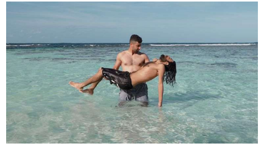
〈リメイン〉2018 © the artist and Milani Gallery

ホダー・アフシャールは、ドキュメンタリー的な映像制作の本質と可能性を探究する。写真と映像にまたがる表現をととしてジェンダーや周縁性、移動について考察。作品では、イメージとの戯れやドキュメンタリー写真の概念的で演出的な側面を融合させることで、伝統的な映像実践を断ち切る試みを行う。近年の展覧会に「WE CHANGE THE WORLD」ビクトリア州立美術館、「PHOTO 2021」(共に2021年、メルボルン、オーストラリア)、ラホール・ビエンナーレ02(2020年、パキスタン)、「Defining Place/Space: Contemporary Photography from Australia」サンディエゴ写真美術館(2019年、カリフォルニア、米国)、「Primavera 2018」オーストラリア現代美術館(シドニー)など。2015年にはNational Photographic Portrait賞、2018年にはBowness Photography賞を受賞(共にオーストラリア)。