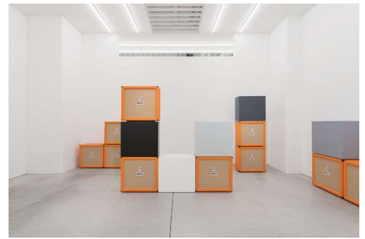
《オレンジスピーカーキャビネットとグレースケールボックス》2009

高校卒業後ロサンゼルスに渡り、カリフォルニア州立大学で1998年と2002年にそれぞれ文学士と美術学修士を取得。ポップアートやミニマリズム、抽象的表現主義などを参考にしながら、それらの思想を独自に展開し、立体と平面、抽象と具象、リアリティとイリュージョンなど、さまざまな二項対立の上に立って、「絵画」と「芸術」の本質を探っている。トロンブリユ(だまし絵)のテクニックを用い、キャビネット、スーツケース、アンブ、鉄骨などをキャンバスで忠実に再現し、観る者を惑わせながらも魅了する。国内外で精力的に展示を続けており、2014年にはロサンゼルス・カウンティ美術館(米国)で個展「Chasing Ghosts」も開催された。