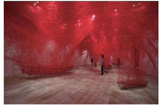
《不確かな旅》2016/2019 個展「魂がふるえる」森美術館、東京 ©JASPAR, Tokyo, 2021 and Chiharu Shiota

2008年、芸術選奨文部科学大臣新人賞受賞。2015年には、第56回ヴェネチア・ビエンナーレ国際美術展(イタリア)の日本館代表に選ばれる。また、ニュージーランド国立博物館テ・パバ・トンガレワ(2020年、ウェリントン)、森美術館(2019年、東京)、南オーストラリア州立美術館(2018年、アデレード)、ヨークシャー彫刻公園(2018年、英国)、国立国際美術館(2008年、大阪)を含む世界各地の個展のほか、国際展などのグループ展にも多数参加。