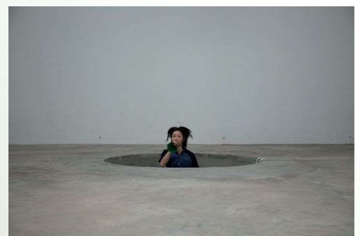
《ランダム・メモ・ランダム(random memo random)》2017 © Aki Sasamoto Courtesy of Take Ninagawa, Tokyo

主な展覧会歴には「Delicate Cycle」スカルプチャーセンター(2016年、ニューヨーク、米国)での個展、「開館40周年展 トラベラー:まだ見ぬ地を踏むために」国立国際美術館(2018年、大阪)、ホイットニー・ビエンナーレ2010(ホイットニー美術館、ニューヨーク、米国)など。