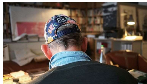
《彼方の男》2019

翻訳者の特殊な主体性に触発されつつ異なるアーティストたち(しばしば奥村自身を含む)の作品及び人生を結ぶことでその重なりと隔たりから世界的本質的な平行性と意識の根源的な相互連結性を探究している。近年は自身のパーソナリティを極限まで削減しようと試みた60-70年代のコンセプチュアル・アーティストたちの方法論に「身体的自己」の表出と「自他合一」への志向性を感知しながら遠い時空から響く彼女たちの声に耳を傾けている。主なプロジェクトに《孤高のキュレーター》(2021年)、《彼方の男》(2019年)、《帰ってきたゴードン・マック=クラーク》(2017年)、《奥村雄樹による高橋尚愛》(2016年)、《グリニッジの光りを離れて——河名編編》(2016年)などがある。