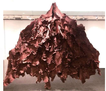
《内秘する者の為にないひするもののために》2018

主な活動は、日本最古の布を再興する越後の「アングインプロジェクト」(2002年-)、日本各地で棉栽培から作品制作までを行う「コットンプロジェクト」(2008年-)など。