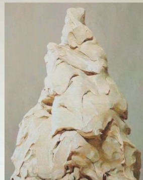
《STATUE(彫像)No.4》2009 名古屋市美術館寄託

1996-1997年フィリップ・モリス財団の奨学金によりクンストラーハウス・ベタニエン(ベルリン、ドイツ)に滞在、1998年IASPISのゲスト・アーティスト(ストックホルム、スウェーデン)。主な個展にロングハウス・プロジェクト(2014年、ニューヨーク、米国)、ギャラリーHAM(2009年、愛知)、グループ展に「消失点-日本の現代美術展」(2007年、国立近代美術館、ニューデリー/プロジェクト88、ムンバイ、インド)など。