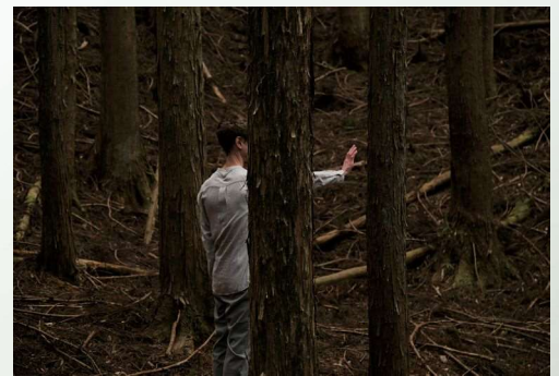
〈Forewarning, Act 2 (Sincerity & Symbiosis)〉2019

作品は台北市立美術館(台湾)、タラワラ美術館(オーストラリア)、MOMENTUM(ベルリン、ドイツ)など世界各地で展示されており、パース・インスティテュート・オブ・コンテンポラリー・アート(オーストラリア)ではパース国際芸術祭2017の一部として個展「Forgiving Night for Day」を開催した。その他、数多くの国際的なフェスティバルやフェローシップ、アーティスト・イン・レジデンスに参加しており、2016年にはJohn Stringer賞を受賞。