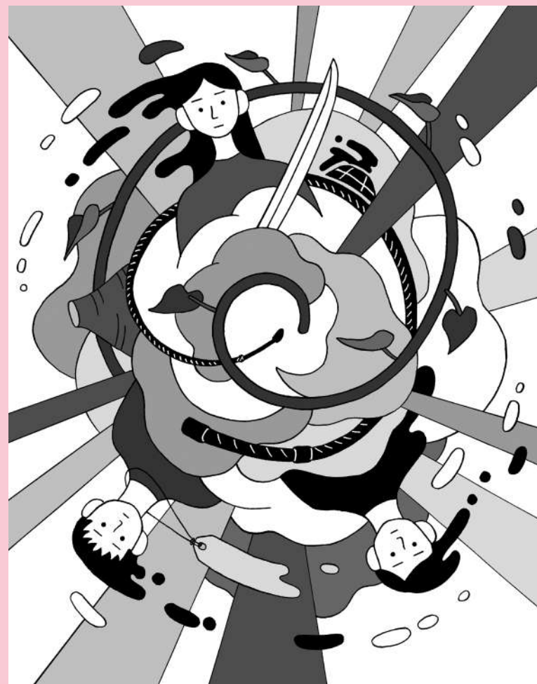
イラスト：大白小蟹

愛知県芸術劇場 小ホール Aichi Prefectural Art Theater, Mini Theater