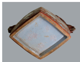
左作品花瓶裏面(上) 左作品台座裏面(下)