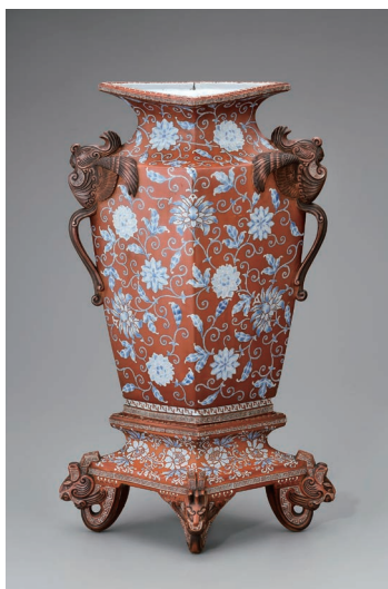
重要有形民俗文化財 鳳凰耳付粉彩菱形大花瓶 川本半助(六代) 明治時代(19世紀後期)