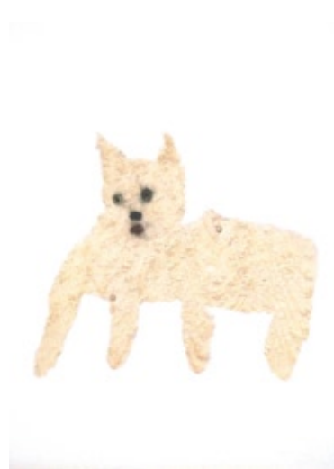
Dog / 犬, 2017