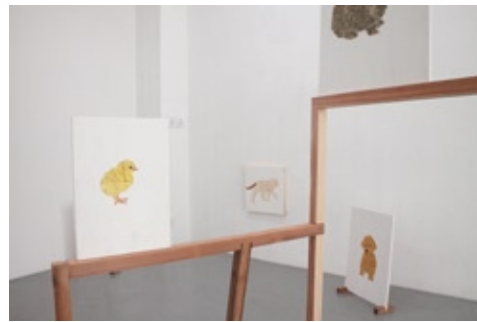
In the jungle / 森の中で, 2016

8 minutes walk from Hisaya Odori station no.1 exit.