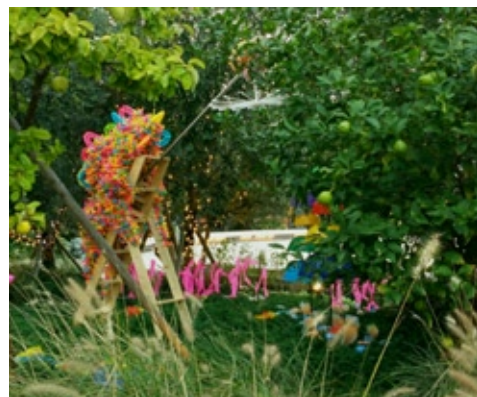
Fishing garden / 釣りの庭, 2016