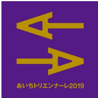
あいちトリエンナーレ 2019 公式ロゴデザイン